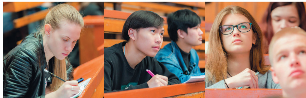
Студенты на лекции турецкого профессора. Кто из них идеальный?