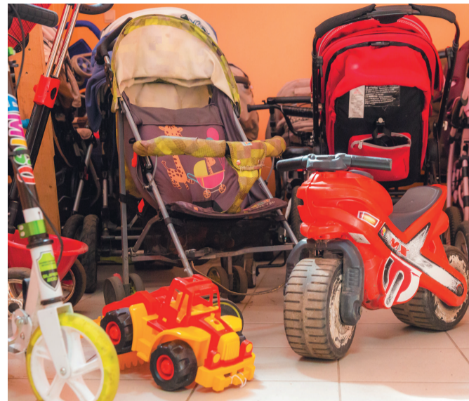
Вход в общежитие - через «гараж».

«Hilton», конечно. И это – мягко говоря. Скорее тянет на гостиницу маленького городка где-нибудь в глубинке. Зданию без малого столет. Перекрытия деревянные. Но по сравнению с новыми общежитиями, «высотками», как их называют, есть одно большое преимущество. Стены – кирпичные, полутораметровые. С такими никакой мороз не страшен.