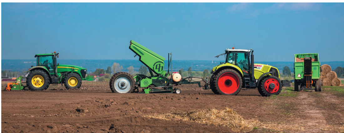
Техника, как на параде.