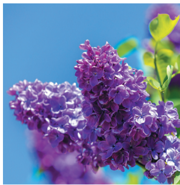
Сирень на пике цветения.