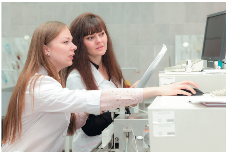
За работой у того самого «печатного станка».