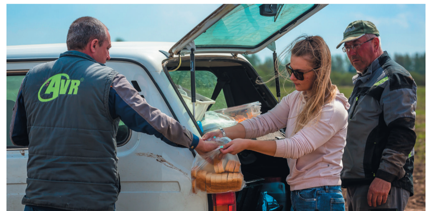
Обед – строго по расписанию.