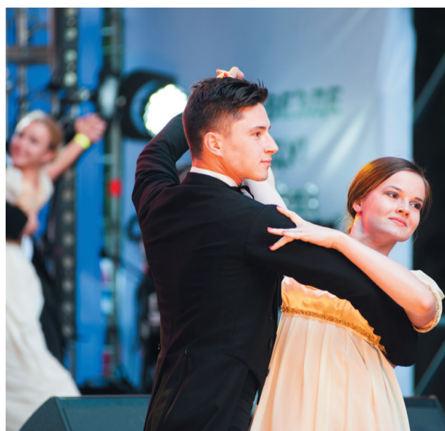
Во время прошлогоднего выпускного бала.

28 июня на торжественной линейке к отличникам присоединятся все выпускники. После выступлений ректора, приглашенных гостей и концертной программы всем присутствующим будет предложено принять участие во флешмобе.