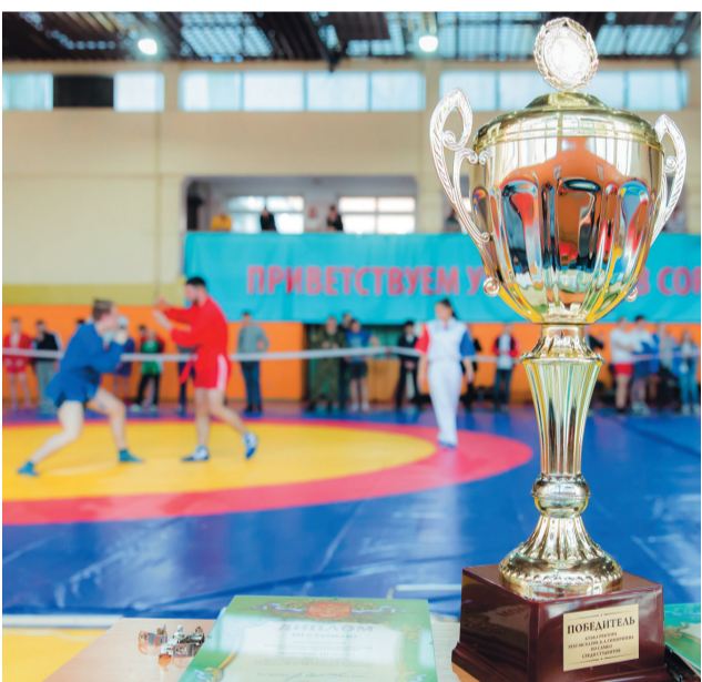
Турнир по самбо на кубок ректора РГАУ-МСХА.

В нынешнем учебном году студенты Тимирязевки добились впечатляющих результатов в соревнованиях самого высокого ранга, включая первенства Москвы и России.