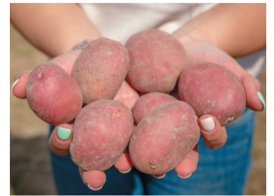
Вот он – семенной картофель.