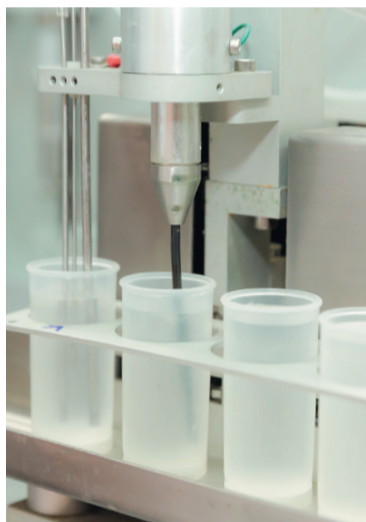
Идет анализ молока.