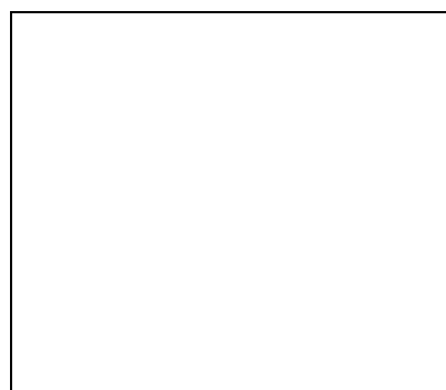
б) после Т.О.