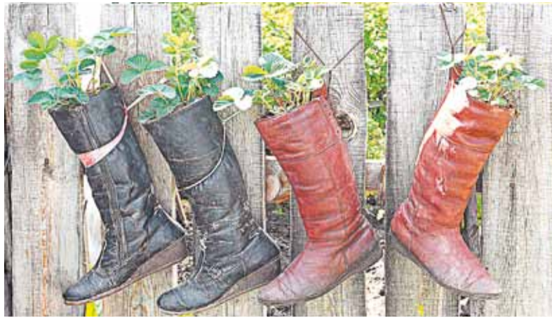
Хорошая ягода и в сапоге вырастет!

Повторноплодоносящая. Если вы решили дополнить свою земляничную плантацию сортами, которые дают несколько